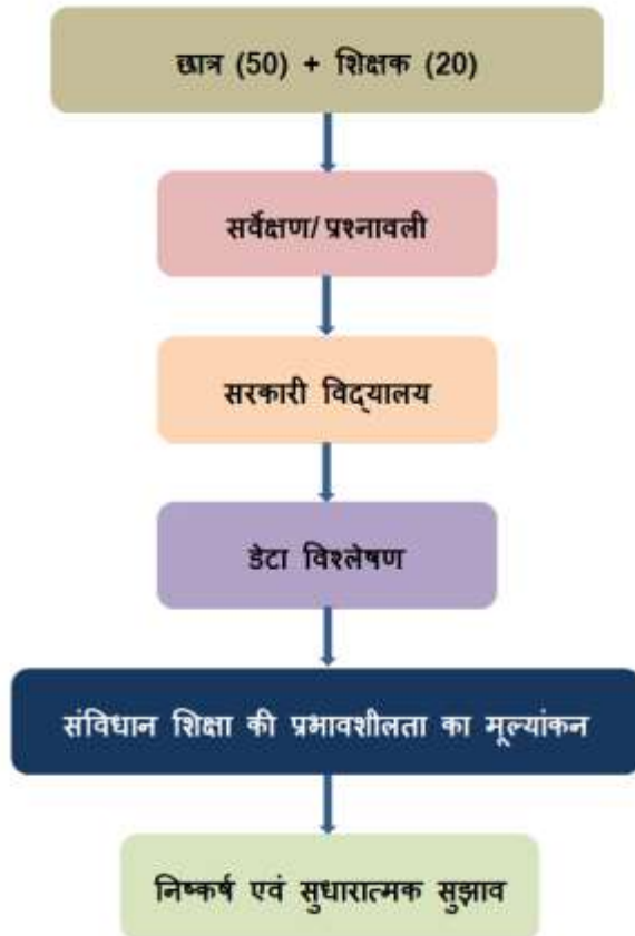
चित्र 1: डेटा संग्रहण एवं विश्लेषण प्रक्रिया।

डेटा संग्रहण के लिए प्रश्नावली आधारित सर्वेक्षण का उपयोग किया गया, जिसमें संविधान शिक्षा की समझ, शिक्षण विधियाँ, पाठ्यक्रम की उपयोगिता, छात्रों की रुचि, तथा व्यावहारिक गतिविधियों की उपलब्धता जैसे प्रमुख बिंदुओं पर प्रश्न शामिल किए गए। प्राप्त प्रतिक्रियाओं का विश्लेषण करके यह समझने का प्रयास किया गया कि संविधान की शिक्षा विद्यार्थियों में लोकतांत्रिक मूल्यों, अधिकारों एवं कर्तव्यों के प्रति जागरूकता बढ़ाने में कितनी प्रभावी है। साथ ही, यह भी देखा गया कि शिक्षकों द्वारा इसे पढ़ाने की पद्धति कैसी है और किन चुनौतियों के कारण इसकी प्रभावशीलता प्रभावित होती है।